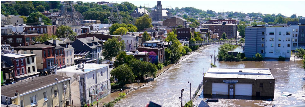
Figura 4: Manayunk después del Ida

de mejora es la planificación de procedimientos de evacuación más eficaces para los ocupantes de espacios bajo el nivel del suelo en caso de inundaciones repentinas. También es importante identificar la ubicación de estructuras vulnerables, en especial estructuras residenciales, y explorar situaciones para protegerlas mejor frente a inundaciones, tormentas y otros riesgos naturales. Asimismo, existe una necesidad de mejorar los métodos de pronóstico, monitoreo, seguimiento y evaluación del impacto de fenómenos meteorológicos extremos. Abordar estas áreas de mejora puede ayudar a la ciudad y a sus socios a prepararse de manera más eficiente para futuros fenómenos climáticos extremos.