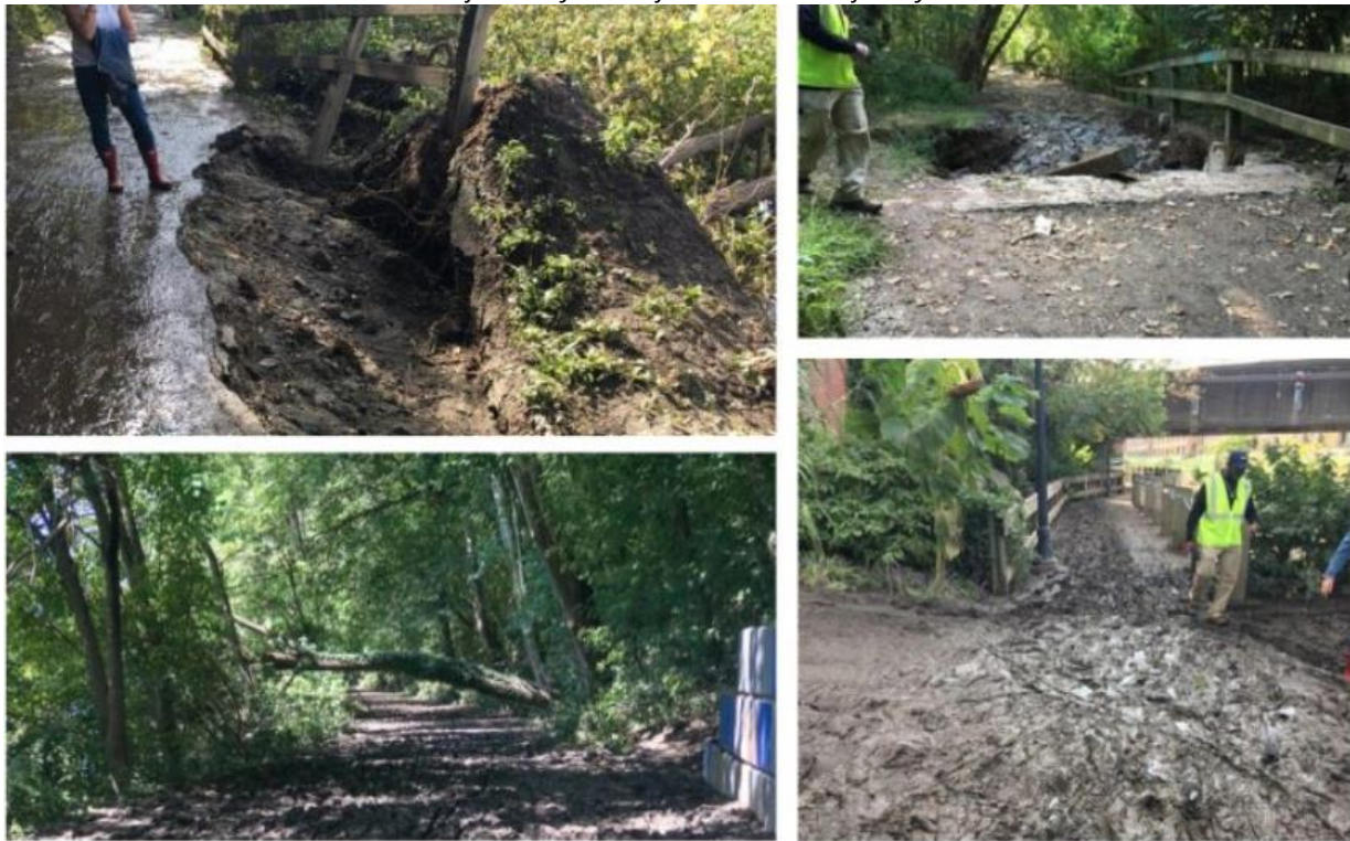
Imaj 3: Santye ak Enfrastrikti Pak ki Afekte yo