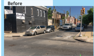
Concrete curb extension Extensión de banqueta de concreto