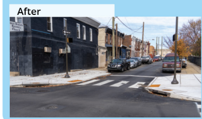
Speed cushions Topes segmentados