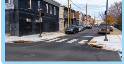
Speed cushions Topes segmentados