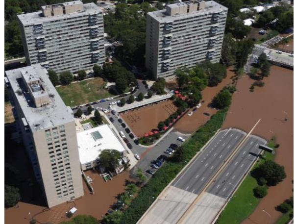
Lũ lụt ở Sông Schuylkill