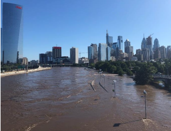
Sông Schuylkill River nhìn về phía Bắc