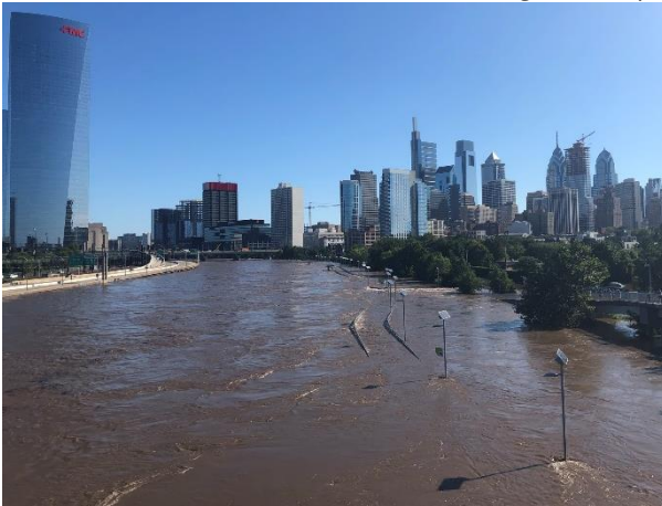
Rio Schuylkill visto para o norte