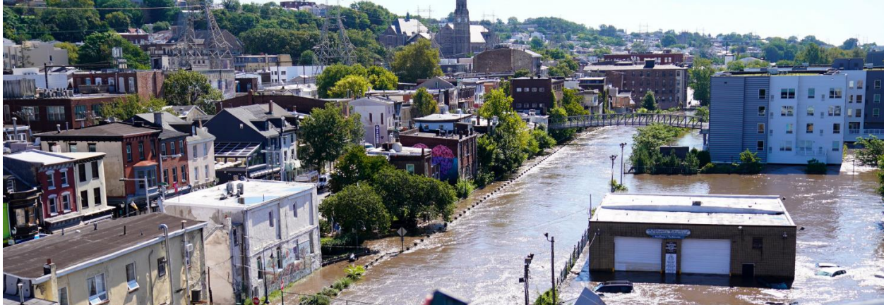
Figura 4: Manayunk depois do Ida

especialmente estruturas residenciais, e explorar soluções para melhor as proteger de enchentes, tempestades e outros riscos naturais. Além disso, há necessidade de aprimorar os métodos de previsão, monitoramento, rastreamento e avaliação dos impactos de eventos climáticos extremos. Abordar essas áreas de melhoria pode ajudar a Cidade e seus parceiros a se prepararem melhor para futuros eventos climáticos extremos.