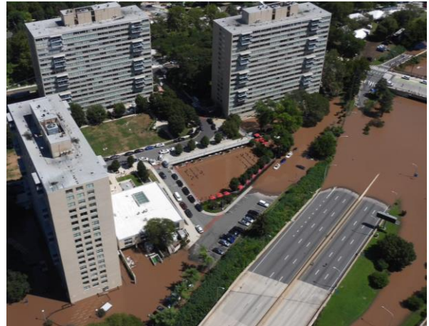
Enchente no Rio Schuylkill