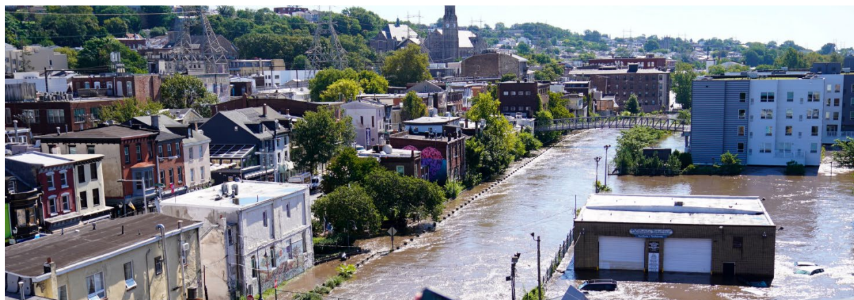
Hình 4: Manayunk sau Cơ Bão Ida

những việc này sẽ giúp Thành Phố và các đối tác Thành Phố chuẩn bị tốt hơn trước các hiện tượng thời tiết khắc nghiệt sau này.