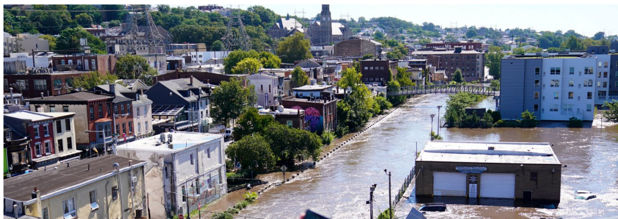
Figura 4: Manayunk después del Ida

de mejora es la planificación de procedimientos de evacuación más eficaces para los ocupantes de espacios bajo el nivel del suelo en caso de inundaciones repentinas. También es importante identificar la ubicación de estructuras vulnerables, en especial estructuras residenciales, y explorar situaciones para protegerlas mejor frente a inundaciones, tormentas y otros riesgos naturales. Asimismo, existe una necesidad de mejorar los métodos de pronóstico, monitoreo, seguimiento y evaluación del impacto de fenómenos meteorológicos extremos. Abordar estas áreas de mejora puede ayudar a la ciudad y a sus socios a prepararse de manera más eficiente para futuros fenómenos climáticos extremos.