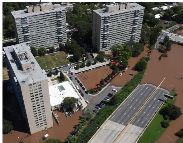
Inundações do rio Schuylkill