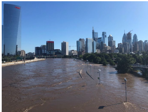
斯库尔基尔河北岸景观