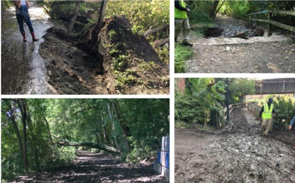
Chema 1-3: Santye ak Enfrastrikti Pak ki Afekte yo

Gen efò ki te fèt pou abòde konsekans tanpèt la, ansanm ak eliminasyon debri toutolon rivyè yo. Debri yo te gen nan yo bwa, veyikil, ak ekipman konstriksyon. Epitou yo te mete an plas plan pou restore rivaj ki te andomaje anpil yo. Gen pwojè espesyal ki te antreprann pou rezoud pwoblèm byen presi tanpèt la te lakòz, tankou ranplasman yon kab sekirite, repare yon anfiteyat deyò nan Dell Music Center, epi rezoud domaj inondasyon yo nan divès teren jwèt. Anplis, ekip yo te travay pou netwaye ak resikle plizyè douzèn pyebwa ki te tonbe.