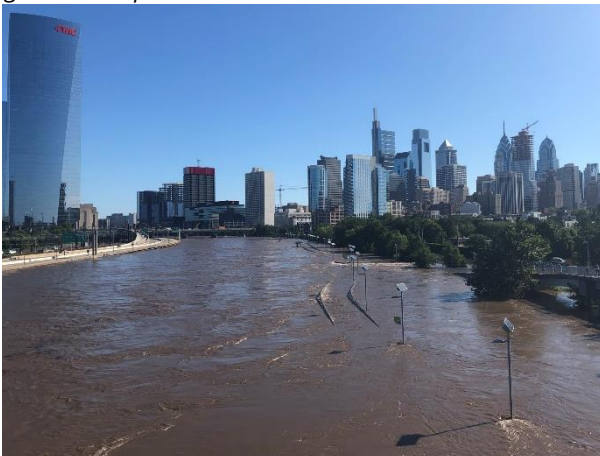
Schuylkill River vista para o norte