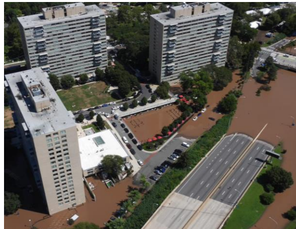
Enchente do Schuylkill River