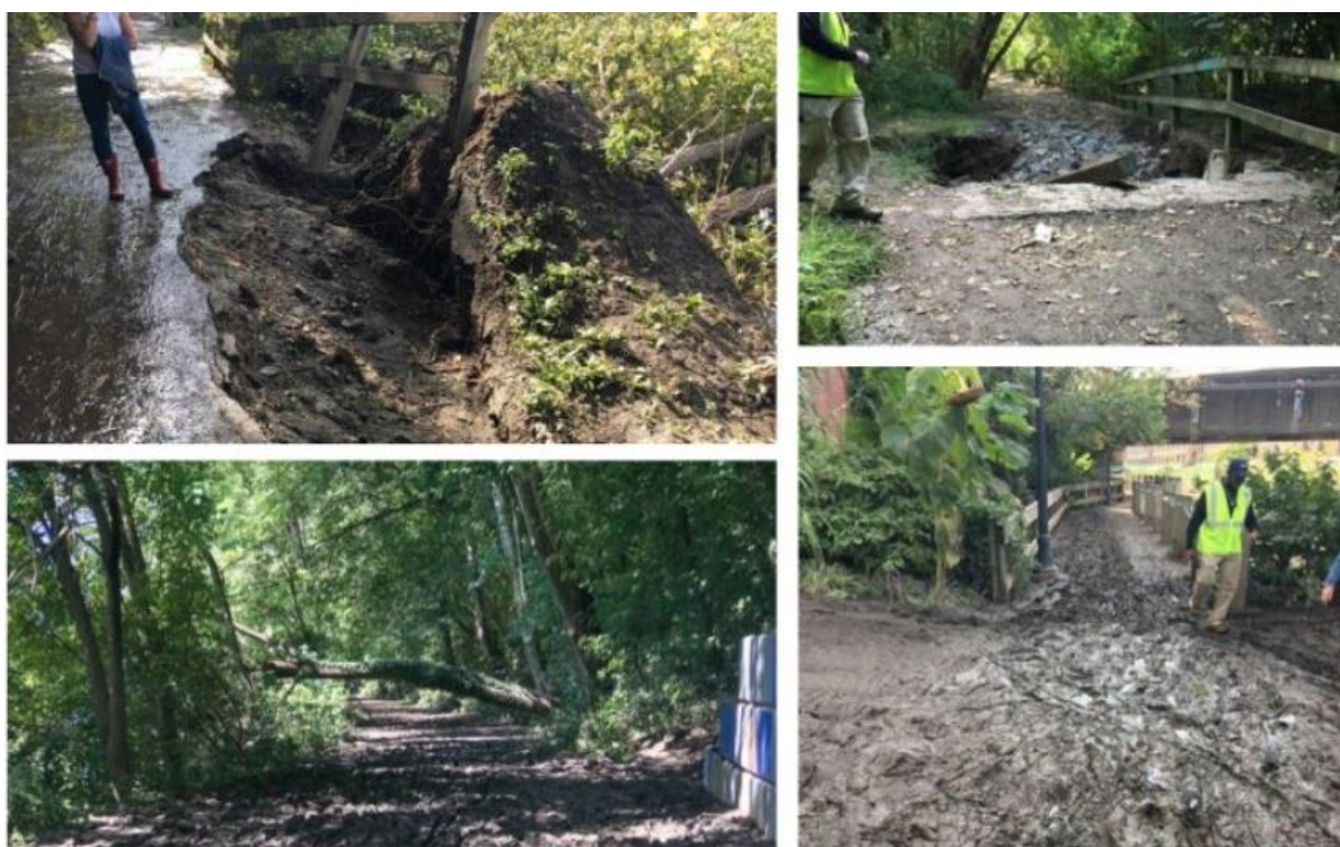
Hình 1-3: Những con đường mòn và cơ sở hạ tầng ở công viên bị ảnh hưởng

Chúng ta cần nỗ lực giải quyết hậu quả của cơn bão, bao gồm cả việc loại bỏ các mảnh vụn dọc các bờ sông. Mảnh vụn có thể là các khúc gỗ, mảnh vỡ từ xe và thiết bị thi công công trình. Các kế hoạch đã được triển khai để khôi phục các bờ suối bị hư hại nặng nề. Các dự án đặc biệt cũng được thực hiện để giải quyết các vấn đề nghiêm trọng do bão gây ra, ví dụ như thay dây cáp an toàn, sửa chữa tòa kiến trúc vòng ngoài trời ở Trung tâm Âm nhạc Dell và giải quyết các hư hỏng do lũ lụt ở nhiều sân chơi khác nhau. Ngoài ra, đội ngũ nhân viên cũng đã dọn sạch và tái chế hàng tá cây bị đổ hạ.