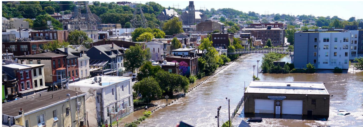
Hình 1-4: Manayunk sau Cơn Bão Ida

Hậu quả của Cơn Bão Ida cho thấy các nhu cầu liên quan đến việc chuẩn bị sẵn sàng ứng phó với các sự kiện thời tiết khắc nghiệt. Một trong những nhu cầu đó là nghiên cứu về nỗ lực giảm nhẹ và phục hồi tiềm năng để giảm tác động của các cơn bão sau này xuống mức tối thiểu. Một phần khác cần cải thiện chính là lên kế hoạch hướng dẫn sơ tán tốt hơn cho cư dân sống ở khu vực đất nền trong trường hợp xảy ra các cơn lũ lớn đột ngột. Việc xác định vị trí của những công trình dễ bị tổn hại cũng rất quan trọng, đặc biệt là những công trình dân cư và đưa ra các giải pháp để bảo vệ họ tốt hơn, tránh khỏi các trận lũ lụt và các mối nguy hiểm tự nhiên khác. Ngoài ra, chúng ta còn cần cải thiện các phương pháp dự đoán, giám sát, theo dõi và đánh giá các ảnh hưởng của hiện tượng thời tiết khắc nghiệt. Sau cùng, các cư dân và thành viên trong cộng đồng phải đánh giá các phương pháp nhằm giảm lượng khí thải carbon và tăng cường phục hồi để giảm nhẹ tác động của biến đổi khí hậu. Cải thiện những việc này sẽ giúp Thành phố và các đối tác của Thành phố chuẩn bị tốt hơn trước các hiện tượng thời tiết khắc nghiệt sau này cũng như xây dựng được tương lai kiên cường và bền vững hơn.