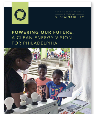
POWERING OUR FUTURE bit.ly/EnergyVisionPHL

Para obtener más información sobre el cambio climático y lo que la ciudad de Filadelfia puede hacer al respecto, consulte los informes que se encuentran a la derecha. Powering Our Future: A Clean Energy Vision for Philadelphia [Potenciar nuestro futuro: Una visión de energía limpia para Filadelfia] ofrece una hoja de ruta para lograr el objetivo del alcalde Kenney de reducir las emisiones de carbono en un 80% para 2050. Destaca las medidas que usted puede adoptar a nivel local, estatal y federal. Growing Stronger: Toward a Climate-Ready Philadelphia [Crecer más fuerte: Hacia una Filadelfia preparada para el clima] identifica los riesgos y los impactos del cambio climático en Filadelfia y las estrategias para abordarlos.